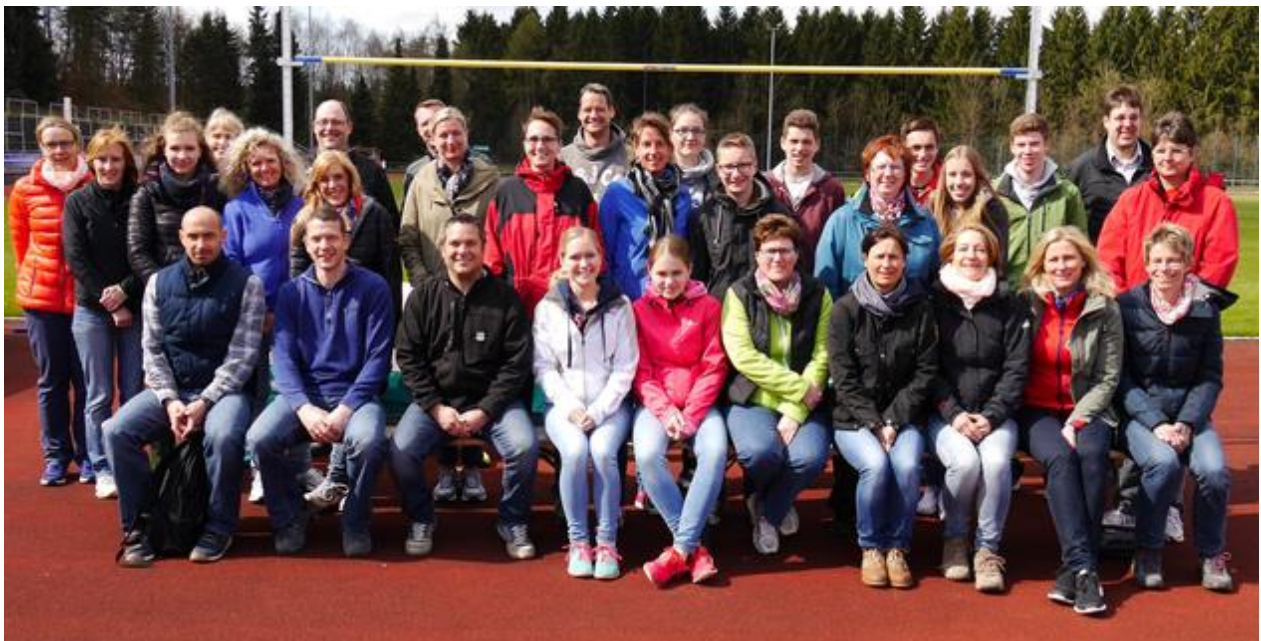
Übung der Praxis an den Anlagen im Olper Kreuzbergstadion

Der Unterrichtssaal im Olper Kolpinghaus war bis auf den letzten Platz gefüllt. Eigentlich hatte die Olper Leichtathletik als Ausrichter für den Kreisleichtathletikausschuss die diesjährige Kampfrichtergrundausbildung im Vereinshaus der Spielvereinigung Olpe im Kreuzbergstadion durchführen wollen. Im Verlauf der Anmeldefrist wurde schnell klar, dass die Räumlichkeiten dort nicht ausreichen. Also wurde rasch reagiert und umgeplant. Im Kolpinghaus war die technische Ausstattung vom Feinsten. Dazu kam die freundliche Unterstützung des Kreissportbundes Olpe, der einen Moderationskoffer und sonstiges Equipment zur Verfügung stellte.